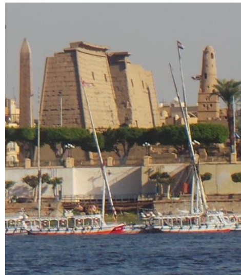
صورة رقم(4) وصورة رقم(5) توضحان ميل حائطي المدخل الخارجي والداخلي نحو المحور الرأسي للمدخل في تشكيل هرمي يضمن الثبات رغم الارتفاع الحجري الهائل - بعدسة الباحث من النيل أثناء الدراسة الميدانية لمعبد الأقصر في أكتوبر/2016م