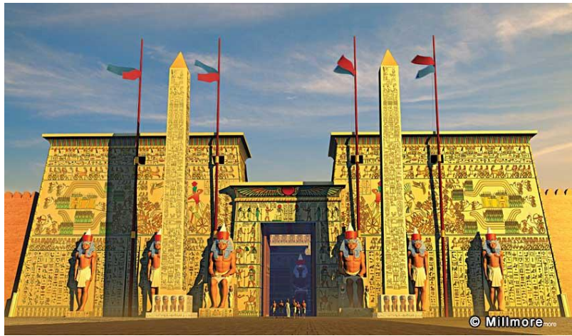
شكل رقم (3) تشكيل رقمي تخيلي 3D لصرح معبد الأقصر يوضح العناصر النحتية للتماثيل الستة والمسلتين وصرح المدخل بما يحويه من جداريات النحت المؤرخة للمعارك والرموز في تشكيل نحتي درامي بديع يعطي الروح التاريخية لهذا التشكيل المعماري الرائع