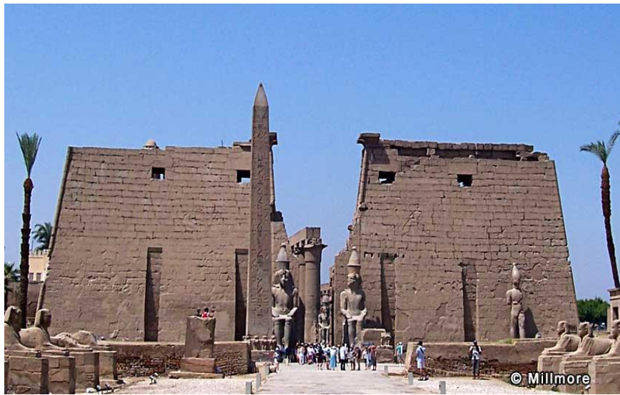
صورة رقم(3) واجهة صرح معبد الأقصر بعد نقل المسلة الأخرى وتهدم باقي التماثيل أو نقل بعضها