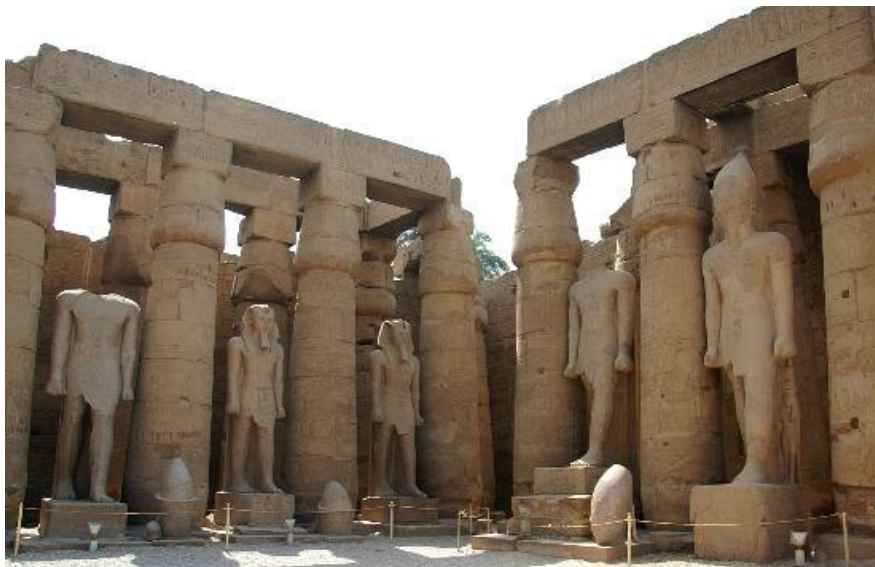
صورة رقم (6) تؤكد العلاقة بين النحت والعمارة في تشكيل المعبد وساحاته حيث نجد التمثال واقفاً بين الأعمدة مكوناً تشكيلاً معمارياً يتميز بروحه التاريخية الموثقة بأحداثها https://www.almrsal.com/wp-content/uploads/2015/03/Luxor-Temple.jpg