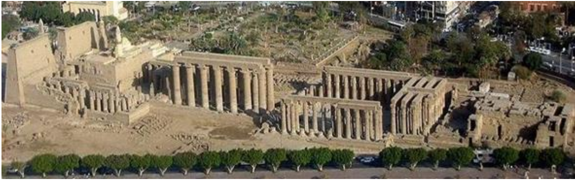
صورة رقم(2) من الجو توضح التشكيل المعماري للمعبد وثباته شامخاً بعد آلاف السنين