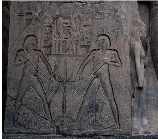
صورة رقم (8) نحت بارز نحت شديد البروز يقترب الى المجسم ملتصق الظهر على قاعدة تمثال رمسيس الثاني في الجزء الأمامي للتمثال بجوار قدمه، بينما نجد في السطح الجانبي منحوت نحتاً غائراً قليل العمق في جرانيت البازلت بأسلوب الحفر المحذوذ في خطوط الريليف الخارجية تظهر تفاصيله مع القليل من الضوء للزائر أثناء دخوله المعبد .

https://upload.wikimedia.org/wikipedia/commons/1/1f/Ramses_II_in_Luxor_Temple.jpg 16/1/2018