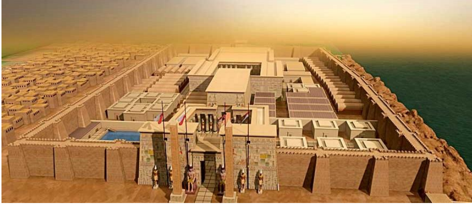
شكل رقم (2) تشكيل رقمي 3D لمعبد الأقصر مكتمل عناصر التشكيل المعماري للمعبد