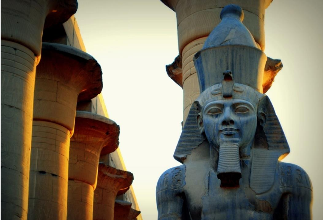
صورة رقم (7) تمثال رمسيس الثاني يوضح مدى التناغم بين الأعمدة كأحد عناصر التشكيل المعماري والتمثال كأحد العناصر النحتية بروحه التاريخية

https://upload.wikimedia.org/wikipedia/commons/1/1f/Ramses_II_in_Luxor_Temple.jpg 16/1/2018